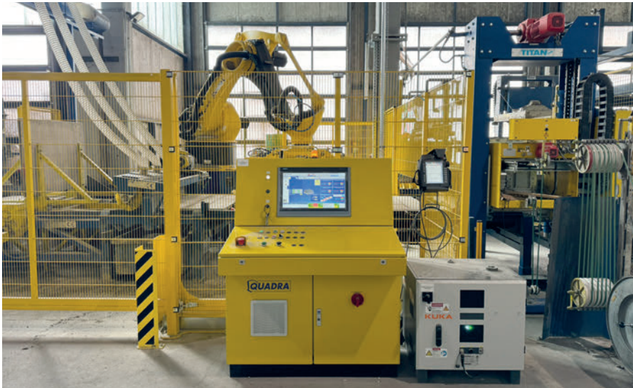
Fig. 1 : Les paramètres de recettes sont ajustables depuis le poste de commande.

Les paramètres de recettes sont ajustables depuis le poste de commande. Visuelle, l'interface permet à l'opérateur d'indiquer le nombre de rang, la position des produits, leur orientation ainsi que le nombre de produits sur chaque rang (Fig. 1).