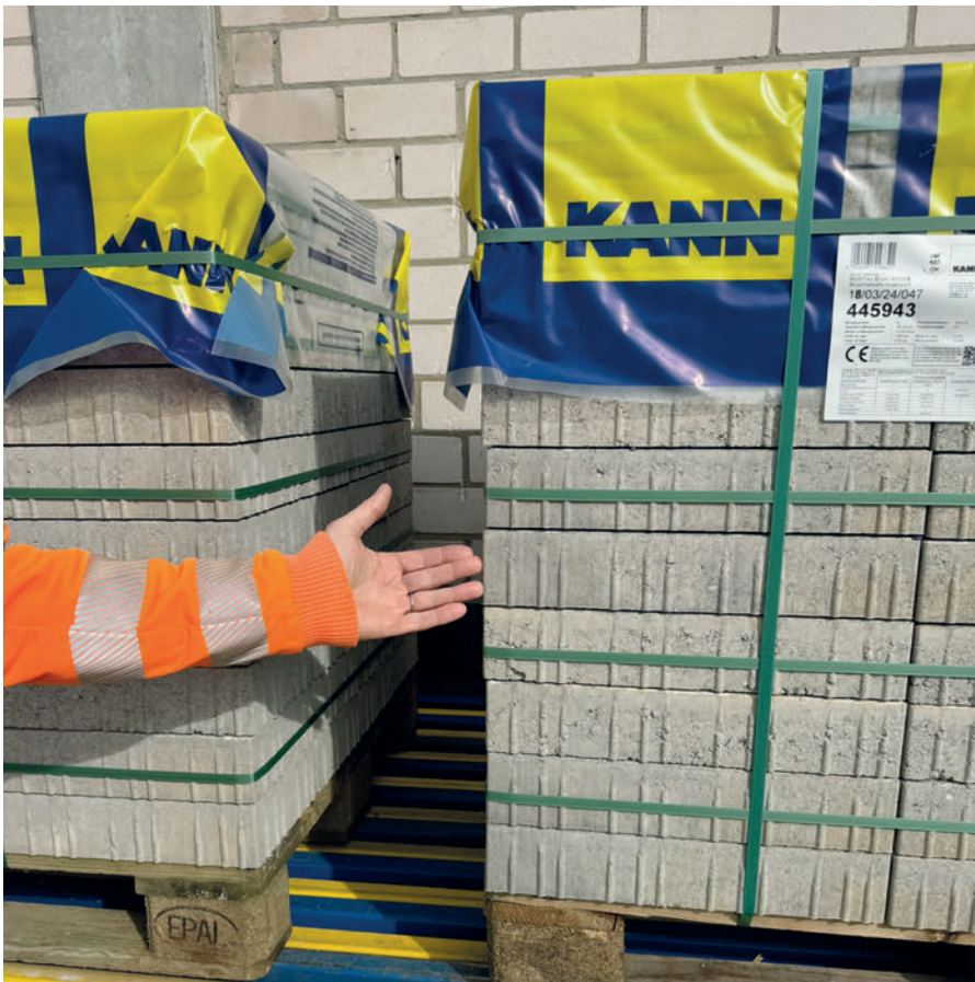
Fig. 2 : La précision de la palettisation des pavés est remarquable.

La pince assure un serrage 4 faces qui lui permet la préhension précise et puissante des produits à déposer sur la palette. La précision de la palettisation des pavés est remarquable et l'alignement vertical des produits bien plus précis qu'avec la méthode conventionnelle (Fig. 2).