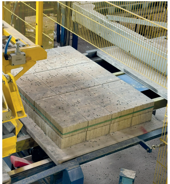
Fig. 4 : Le robot palettiseur Kuka KR 700 a une capacité de levage de 700 kg équivalente à une charge de 350 kg de produits en béton

Dans le cadre de l'exploitation de son nouvel équipement, Kann bénéficie d'un accès à la plateforme collaborative en ligne proposée par le constructeur, spécifiquement développée en allemand pour l'occasion. Conviviale, interactive et intuitive, celle-ci lui permet de transmettre ses demandes rapidement et facilement (demande d'informations, déclaration d'incident et demande de devis). Il a également la possibilité d'accéder à son catalogue de pièces détachées, de télécharger la documentation technique de son matériel, ainsi que les notices d'utilisation, les schémas électriques et pneumatiques, le planning de maintenance préventive, le plan de sécurité et l'ensemble de certificats de conformité, le tout en allemand. Une formation à l'utilisation du matériel lui a également été dispensée en allemand.