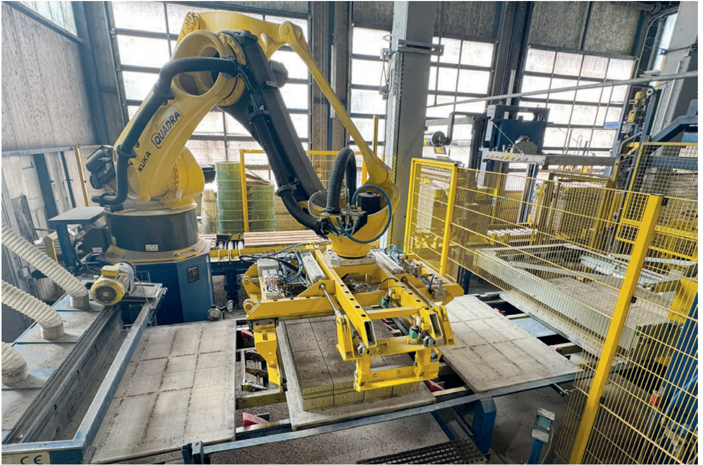
Fig. 3 : A l'origine orange, le robot Kuka KR 700 programmé par Quadra pour Kann a été personnalisé aux couleurs de l'identité de marque du client, jaune et bleu

Autres avantages de la solution automatisée: le système de guidage linéaire des rails positionnés sur les pièces de maintenance autorisant un mouvement fluide et régulier limite l'usure et par conséquent les opérations de maintenance ou le renouvellement du matériel.