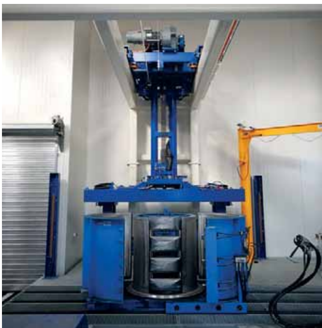
Los anillos de pozo y conos de pozo se vierten en moldes con apertura hidráulica. Para el desencofrado, el operario activa el sistema hidráulico y los moldes se abren.

Las paletas con los productos terminados son transportadas hacia afuera del edificio mediante una carretilla de horquilla que está equipada con un accionamiento eléctrico controlado mediante un convertidor de frecuencia y son almacenadas sobre una rampa de 20 m de largo. Esta solución tiene la ventaja de que permite almacenar automáticamente unas quince paletas fuera del edificio de fabricación. Este almacenamiento intermedio automático ofrece mayor flexibilidad organizativa y aumenta la eficiencia en relación a la productividad, ya que las paletas con los productos terminados pueden