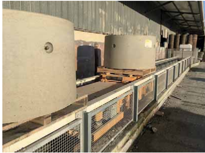
Una carretilla de horquilla transporta las paletas con los productos terminados hacia afuera del edificio, donde se colocan en serie sobre una rampa de almacenamiento de 20 m de longitud.

retirarse de la instalación de producción durante aproximadamente una hora, sin que una carretilla elevadora tenga que estar disponible inmediatamente en fábrica para la manipulación subsiguiente.