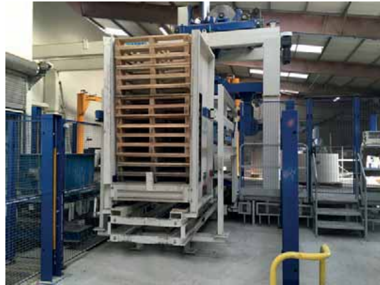
La línea de fabricación es alimentada mediante un depósito intermedio, en el que pueden almacenarse hasta 20 paletas.

Tras el secado en la cámara de secado, los moldes se vuelven a retirar del alimentador de estantes y se colocan sobre el