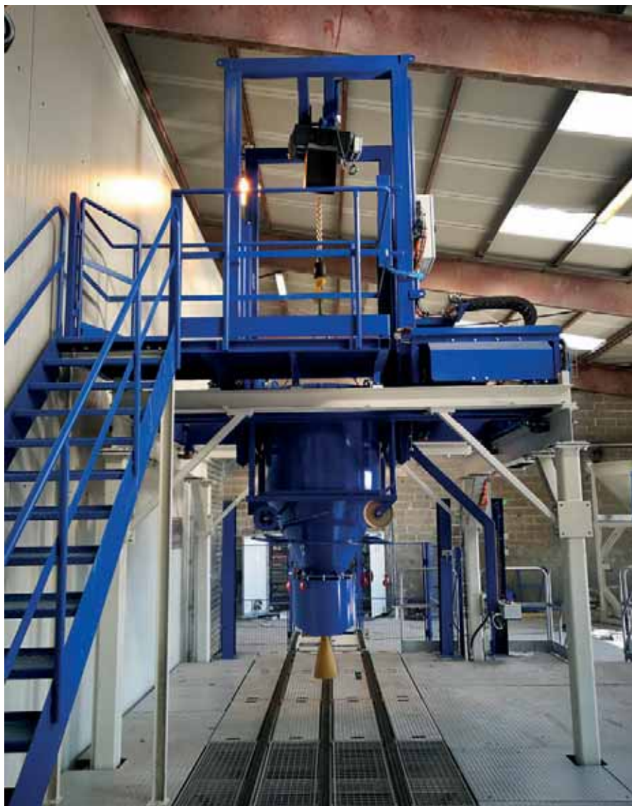
Llenado de los moldes

La estación de llenado está equipada con un polipasto de cadena eléctrico integrado en el dispositivo de dosificación, con el cual pueden moverse los moldeadores para el cono de pozo. Estos se elevan durante el llenado del hormigón en el molde y, tras finalizar el proceso de hormigonado, se vuelven a bajar al molde.